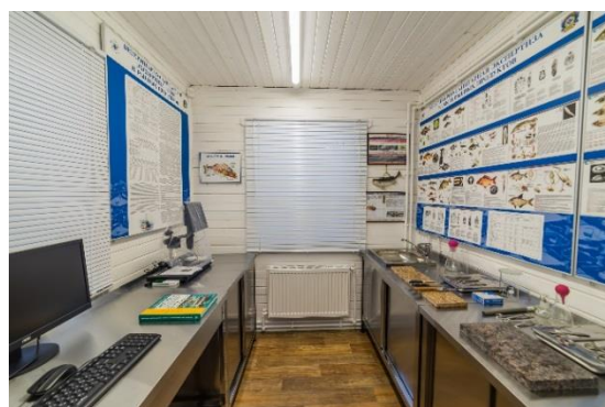
Здание и лаборатория Регионального центра.