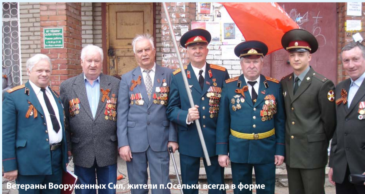
Ветераны Вооруженных Сил, жители п.Осельки всегда в форме