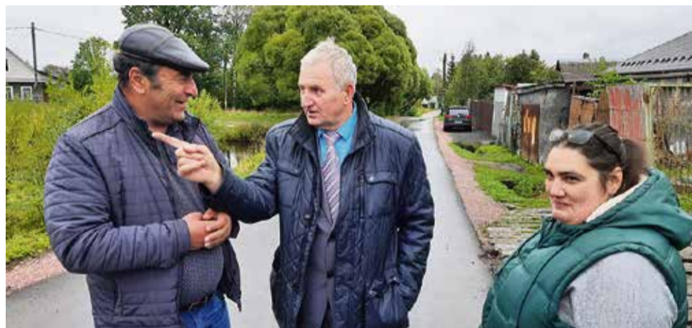
Укладка асфальта на ул. Красноармейской, д. Верхние Осельки