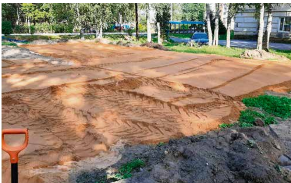
Спортивная площадка, п. Осельки, между д. 3 и д. 4