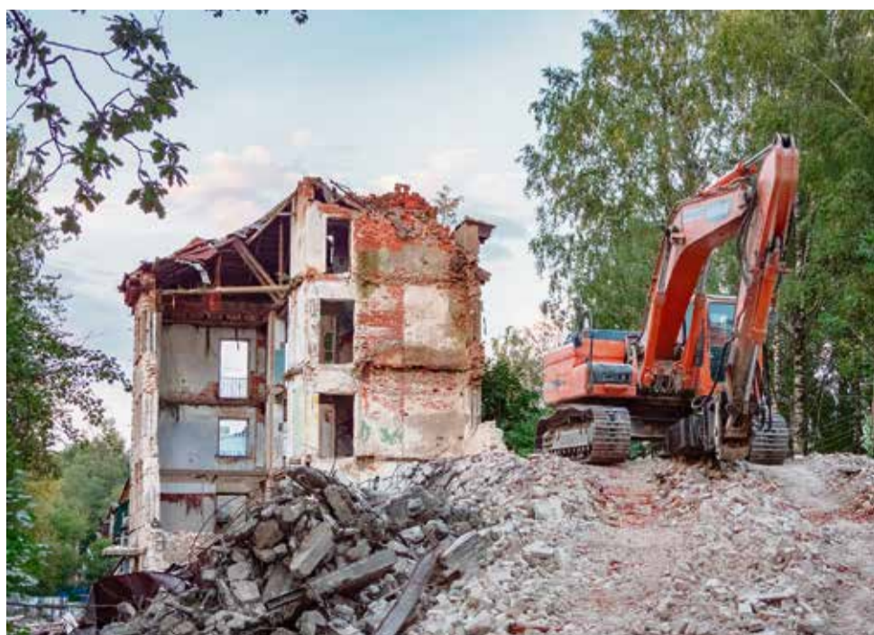
Снос дома № 1 п. Осельки

фонда на территории Ленинградской области в 2019 – 2025 годах» дома подлежат расселению.