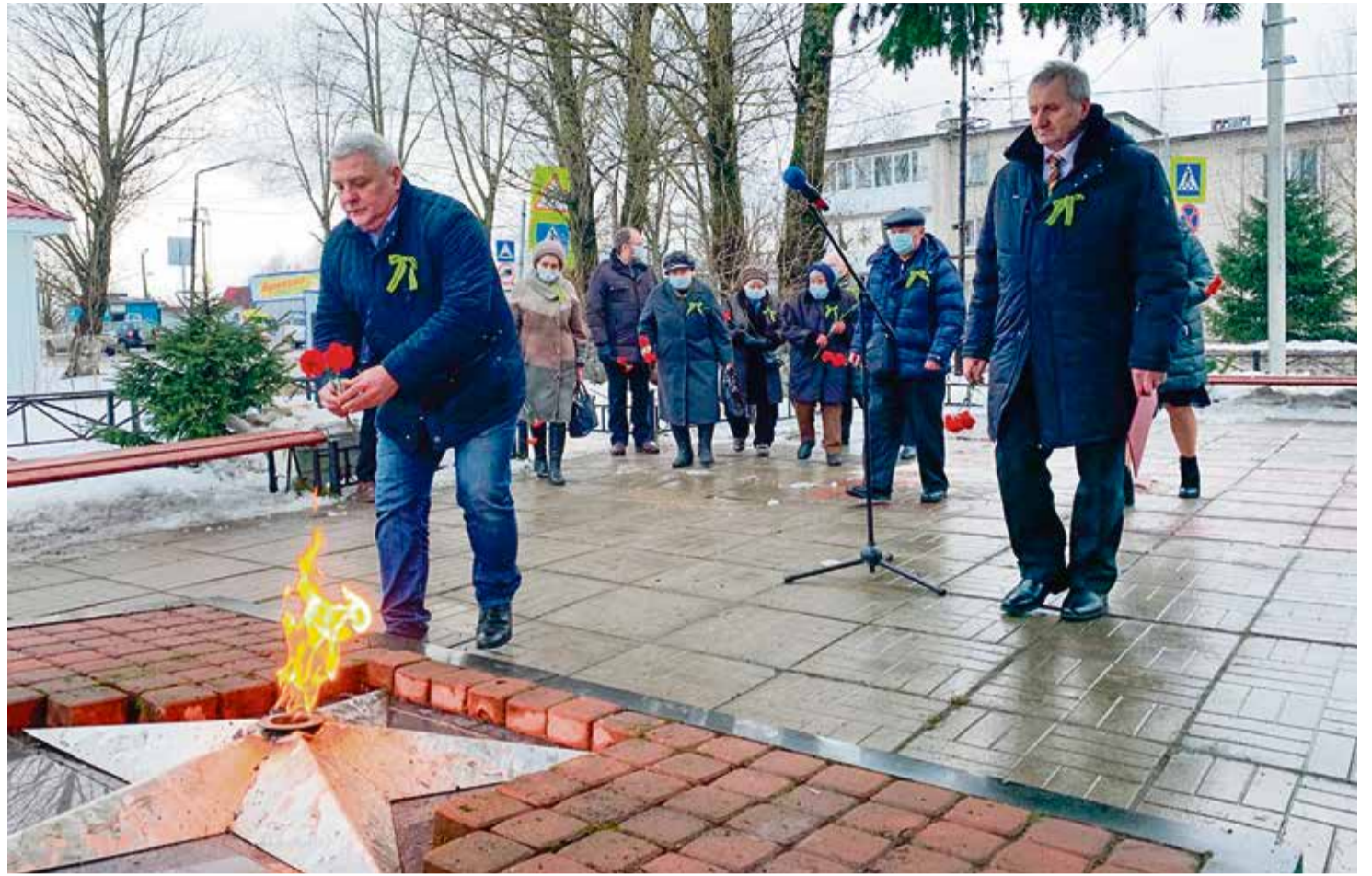
Возложение цветов в День снятия блокады

Продолжается достигнутое ранее конструктивное сотрудничество совета депутатов с различными государственными и муниципальными структурами и иными организациями. В 2020 году депутаты Лесколовского сельского поселения представляли интересы муниципального образования в представительном органе Всеволожского района, муниципальной школы, взаимодействовали с Ассоциацией «Совет муниципальных образований Ленинградской области». Совместно с администрацией продолжена работа с политическими партиями и депутатами Законодательного собрания Ленинградской области по организации помощи в финансировании благоустройства объектов поселения. Хочу отдельно поблагодарить за помощь и поддержку нашей инициативы депутатов Законодательного