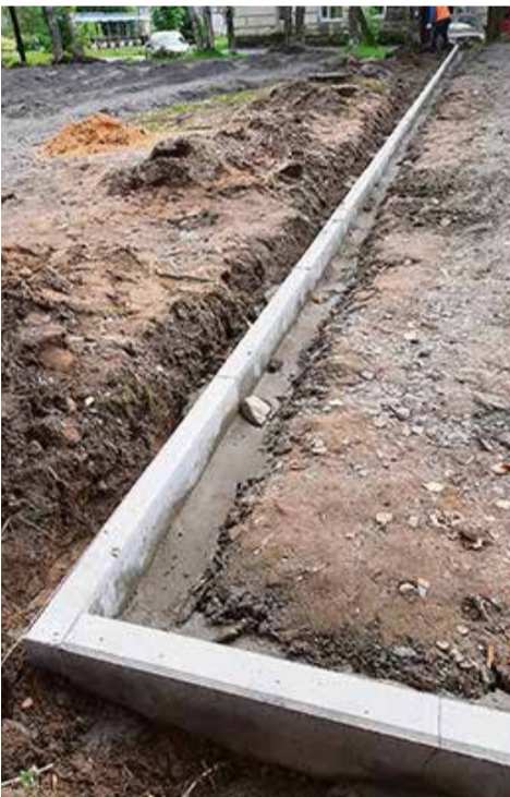
Теплотрасса за домом 110, до и после ремонта