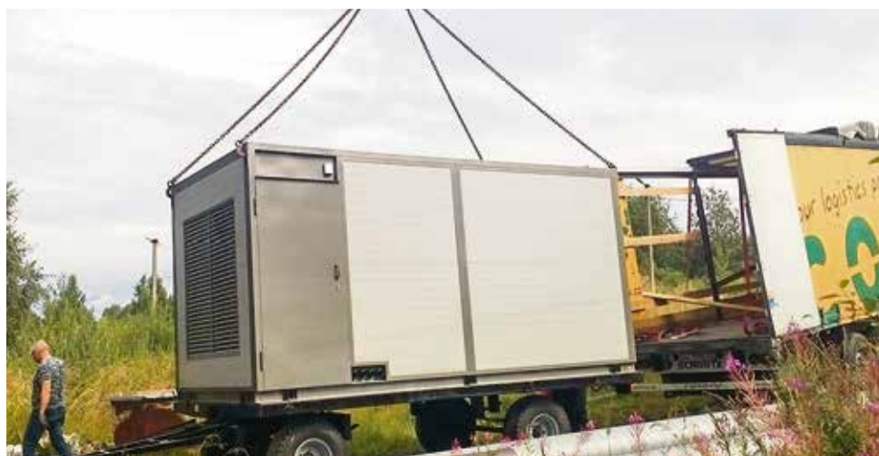
Дизель-генератор на котельной № 22, д. Лесколово