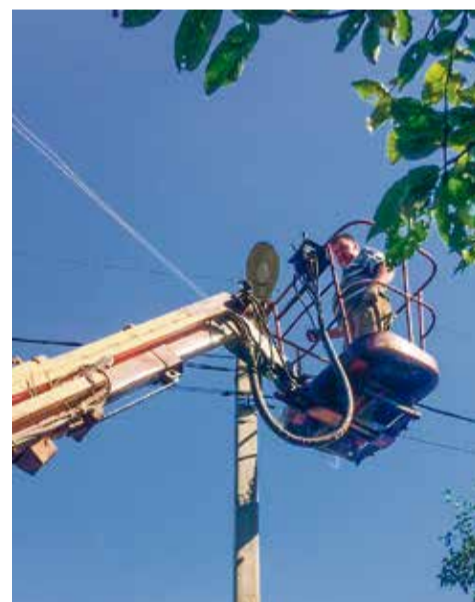
Освещение в Хиттолово