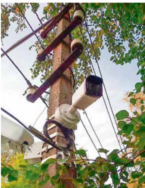
Установка камер видеонаблюдения