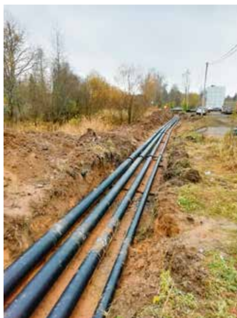
Теплотрасса за домом 108, п. Осельки

Сумма налоговых и неналоговых доходов бюджета МО «Лесколовское сельское поселение» Всеволожского муниципального района Ленинградской области составляет 63 582,7 тыс. руб., что составило 103,8% от всей суммы поступления 2020 года. Безвозмездные поступления от бюджетов других уровней на 01.01.2021 года составляет 53 436,0 тыс. руб.