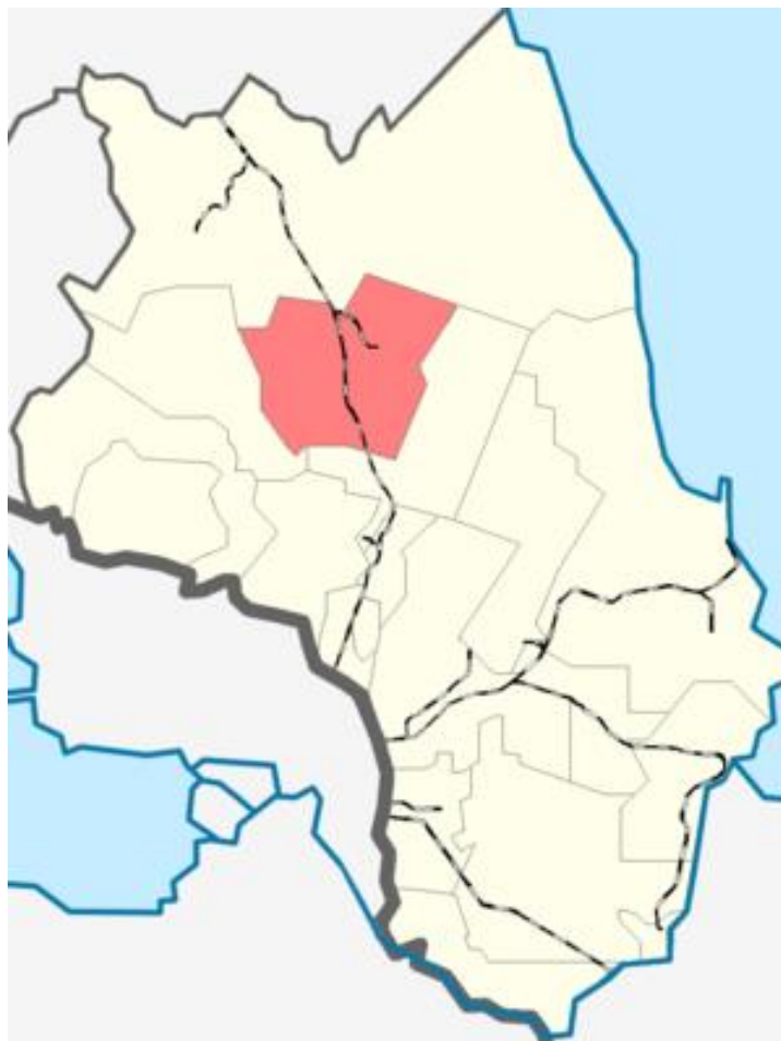
Рисунок 2.1 – Территориальное расположение МО «Лесколовское сельское поселение»