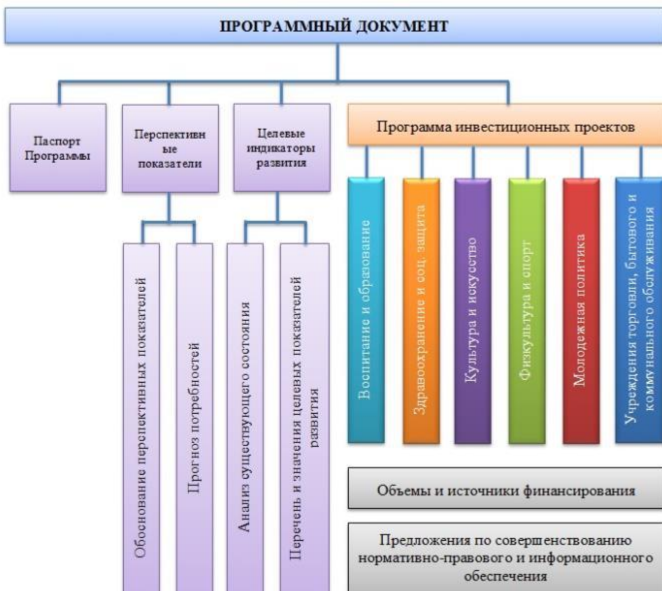
Рисунок 8.1 – Модель Программы комплексного развития социальной инфраструктуры

Программа представлена в виде базы данных структурированной и неструктурированной информации.