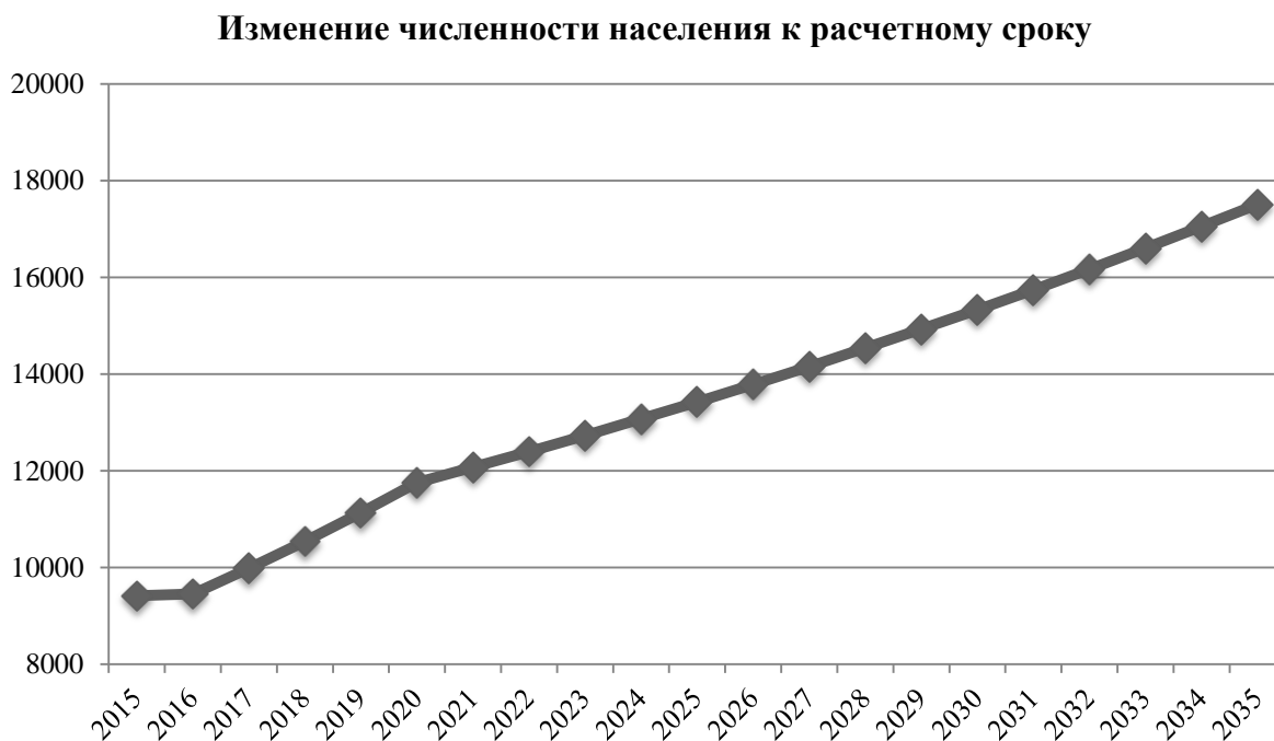
Рисунок 2.4 – Динамика изменения численности населения к расчетному сроку

Проведя анализ рисунка 2.3, а также согласно данным Администрации, к расчетному сроку прогнозируется следующая демографическая ситуация (рисунок 2.4).