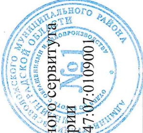
Схема расположения границ публичного сервитута на кадастровом плане территории Кадастровые кварталы 47:07:0153001, 47:07:0109001

Приложение к постановлению администрации Всеволожского муниципального района Ленинградской области от 21.06 2014 г. № 2333