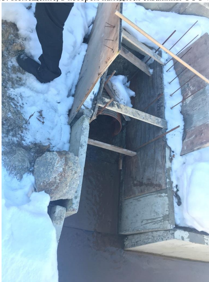
Фото 14. Выпуск сточных вод в железобетонный лоток после локальных очистных сооружений ООО «ОМХ»