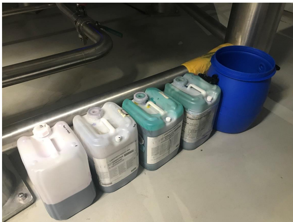
Фото 8. Пластиковая тара, наполненная красителем

Цех по производству жидких моющих средств ООО «ВЕЛЛ РУС» оборудован системой отведения сточных вод, образующихся в результате производственной