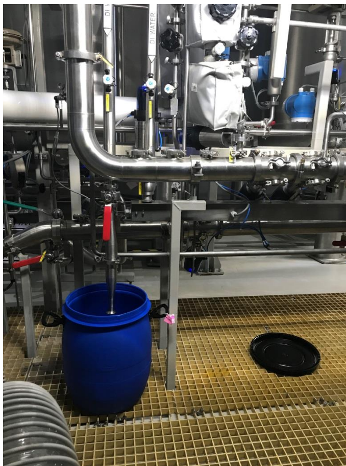
Фото 7. Пластиковая тара, наполненная красителем