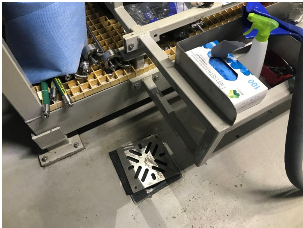
Фото 9. Система сбора сточной воды из производственного цеха

деятельности лица – пол оборудован сливными отверстиями для сбора сточной воды.