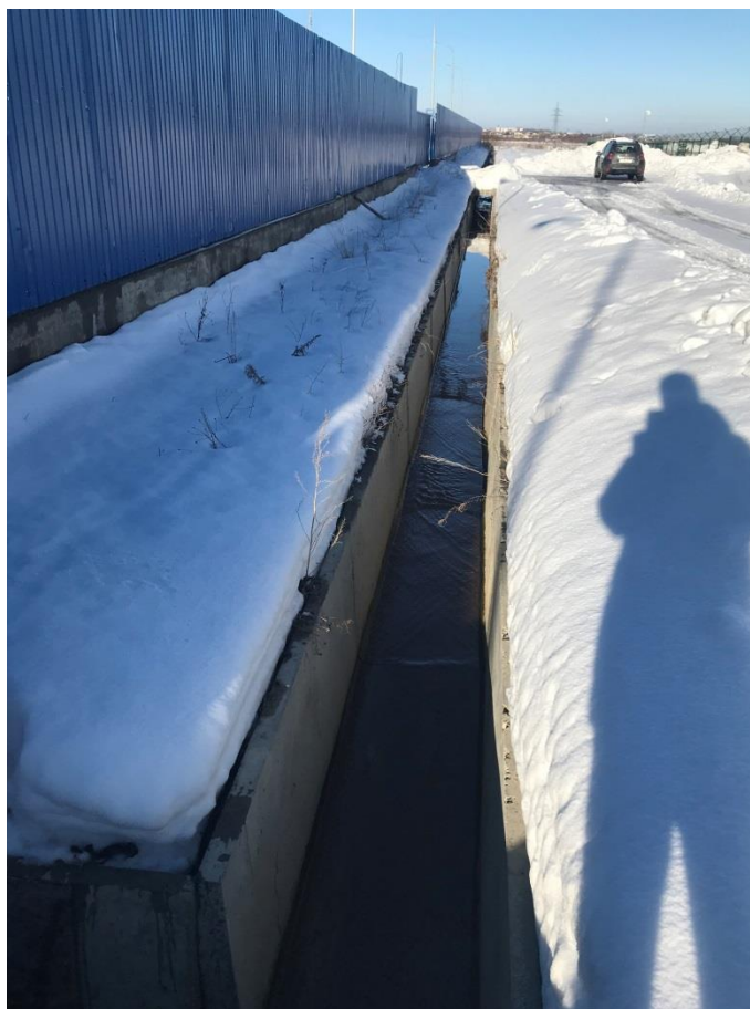
Фото 15. Железобетонный лоток, куда осуществляется выпуск сточных вод после локальных очистных сооружений ООО «ОМХ»