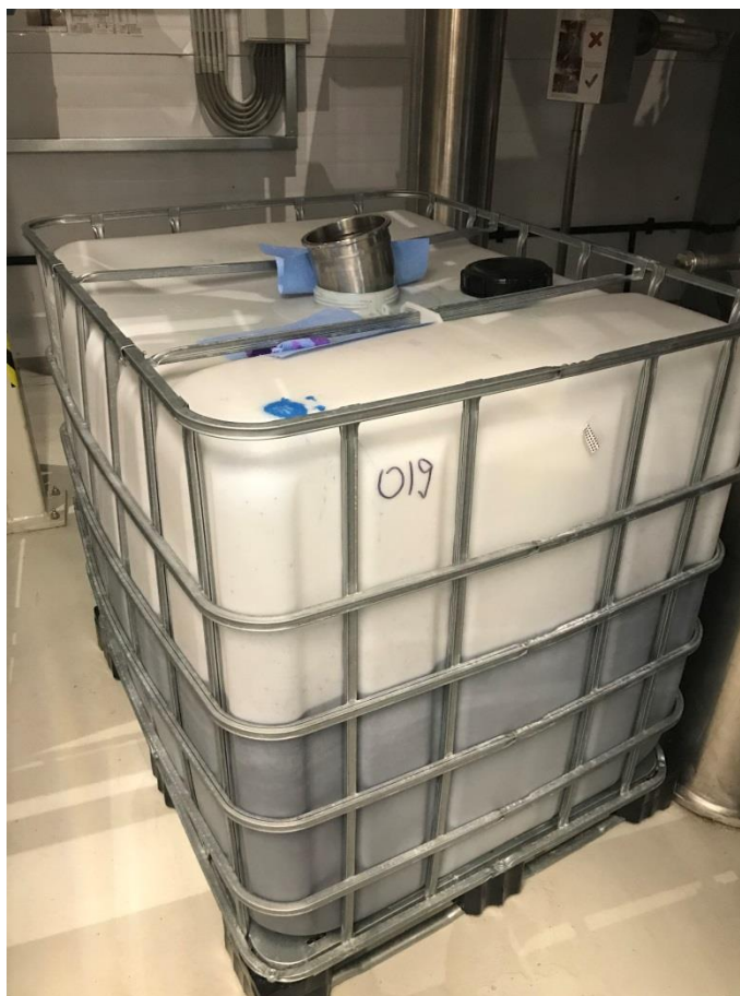
Фото 5. Пластиковый куб, наполненный наполовину синей жидкостью с химическим запахом