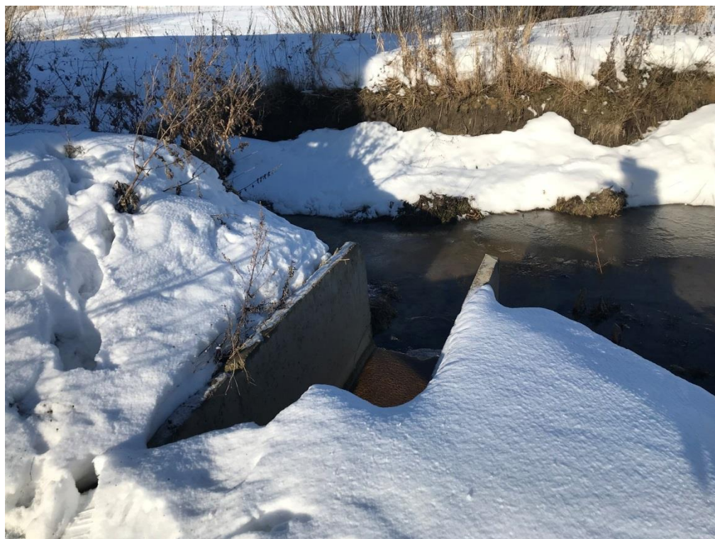
Фото 16. Выпуск сточных вод в канализированный ручей МК-1, приток реки Ижора после очистных сооружений ООО «ОМХ»