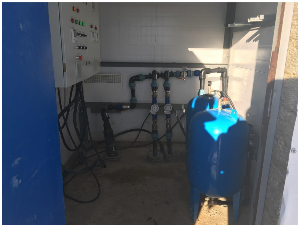
Фото 13. Помещение, в котором находятся скважины ООО «ОМХ».