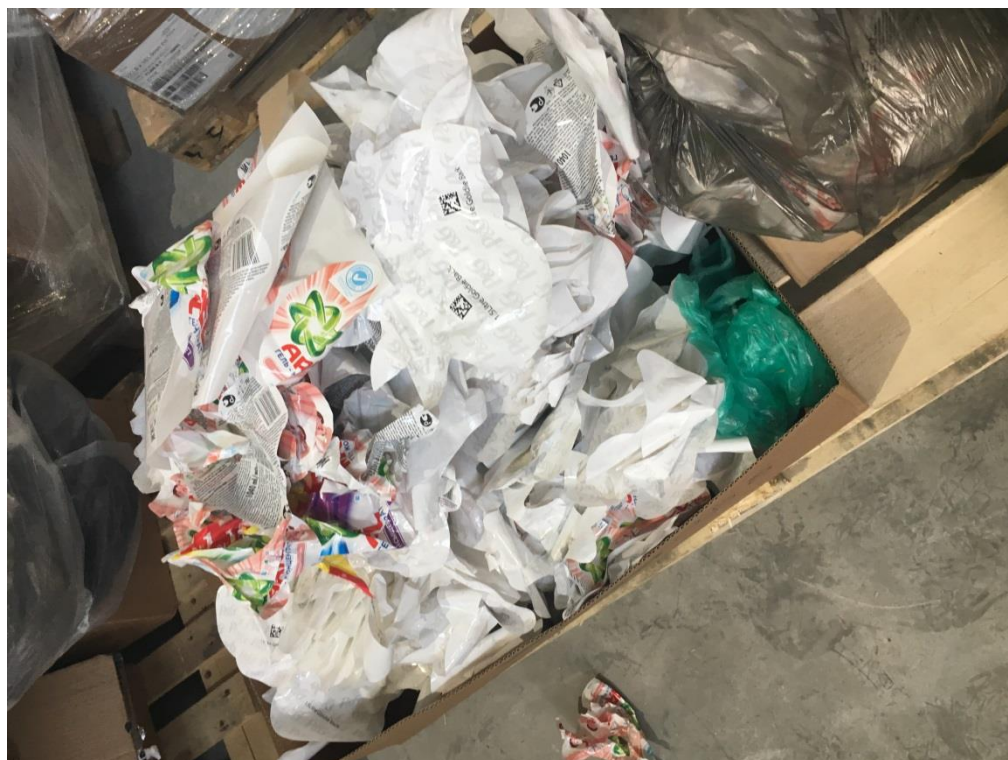
Фото 11. Этикетки, утратившие потребительские свойства

свойства, и тара пластиковая, предположительно используемая для разлива продукции.