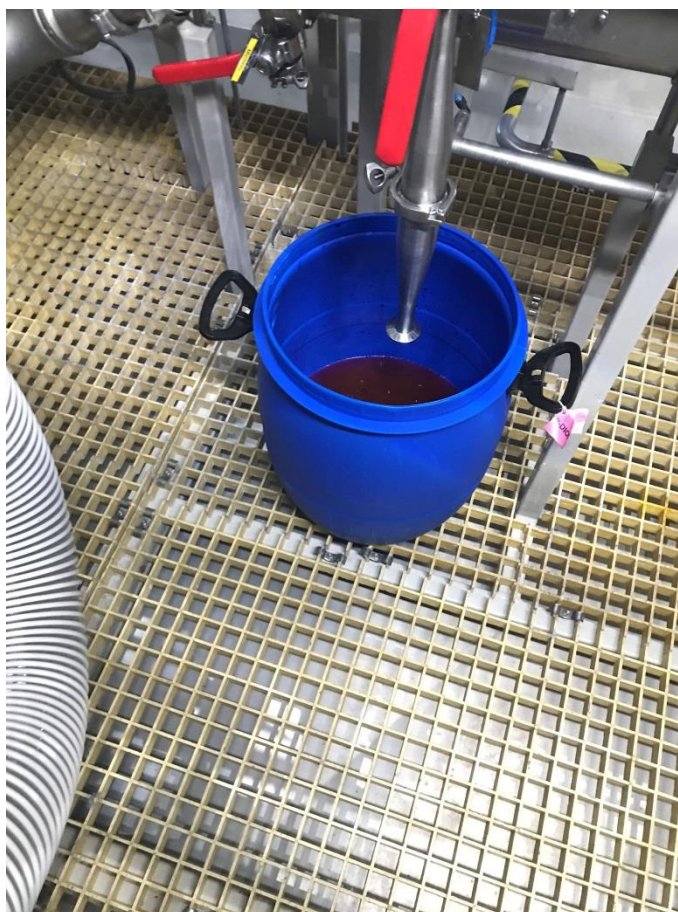
Фото 6. Пластиковая тара, наполненная красителем