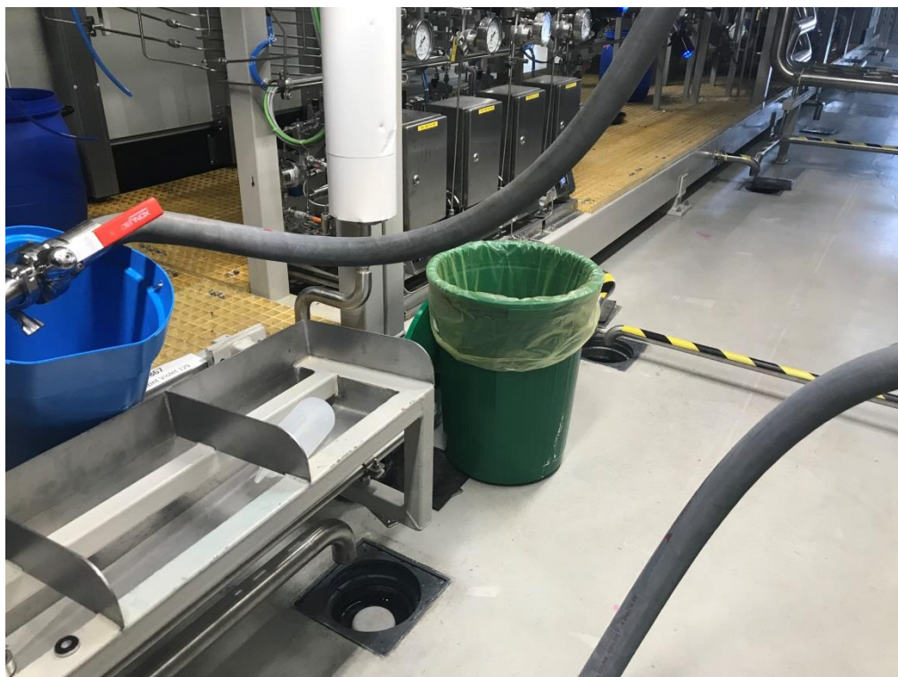
Фото10. Система сбора сточной воды из производственного цеха

Также в ходе проведения осмотра производственной площадки ООО «ВеллРус» обнаружены этикетки известных брендов, утратившие потребительские