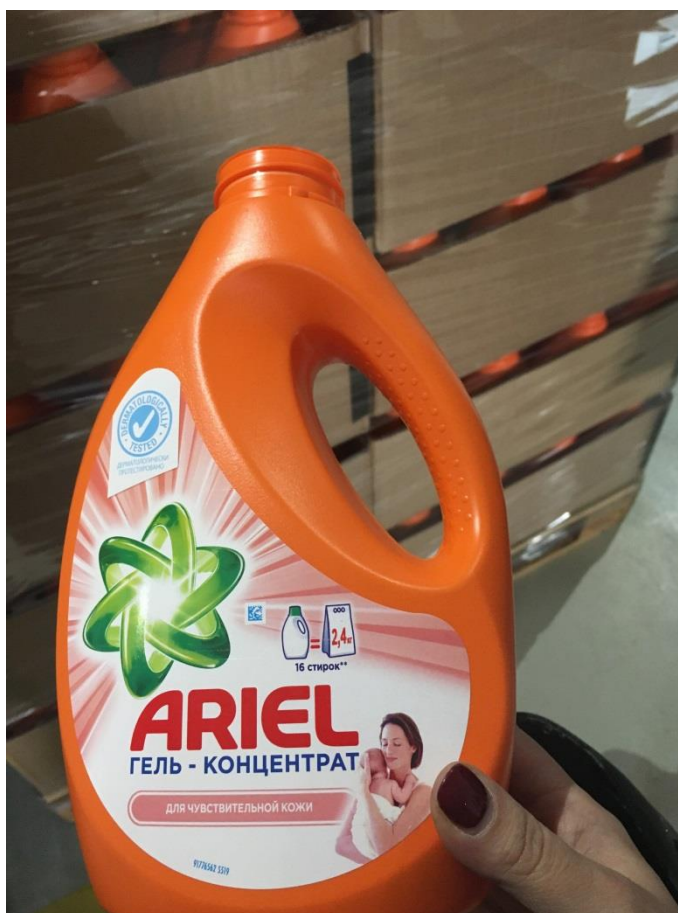
Фото 12. Тара пластиковая предположительно используемая для разлива продукции