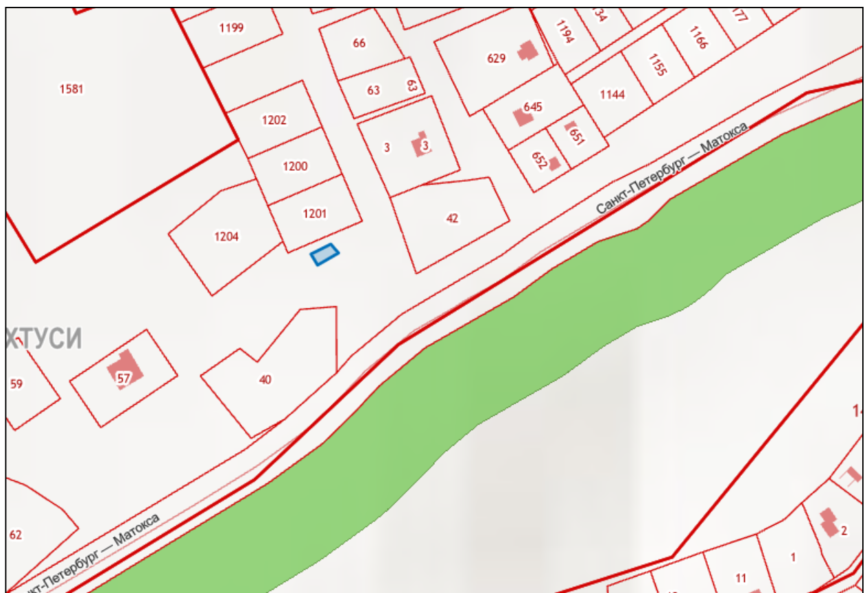
Схема 19 Ленинградская область, Всеволожский район, Д. Лехтуси, ул. Центральная, вблизи участка 2 «б»